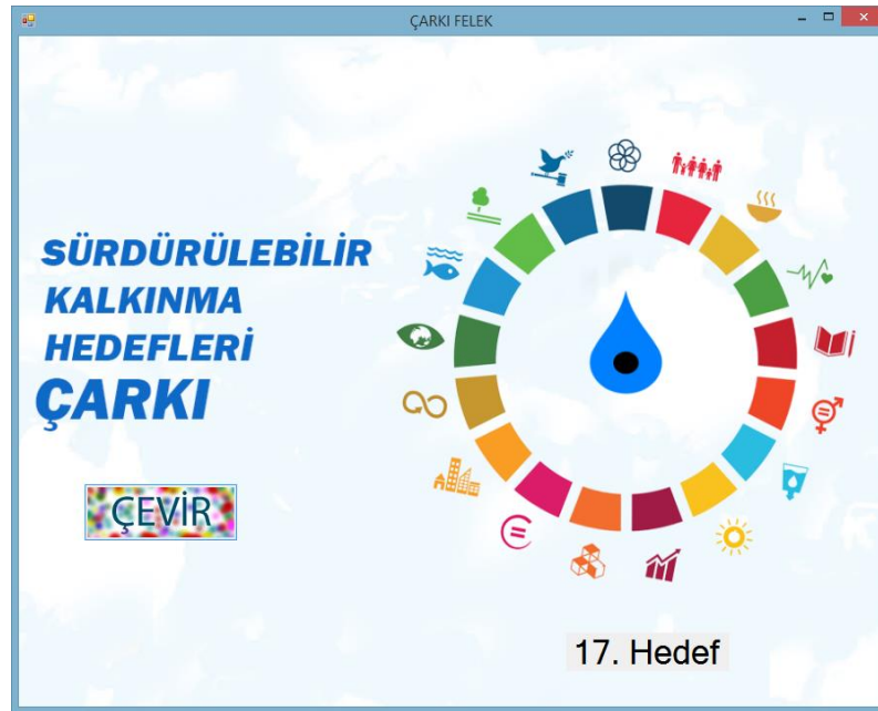
Resim 6a. Çarkıfelek Oyunu (Kelime Bulma)