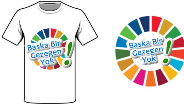
Resim 7. T-Shirt ve Rozet Tasarımları

Fazlalık: Bilindiği üzere kendi üzerinde ayakta durabilen bir sistem tasarlanmıştır. Sosyal girişimin yıllık yaklaşık 220 TL'ik web sitesi masrafı düşüldükten sonra kalan kar hedef kitle öğrencilerinin sosyal sorumluluk çalışmaları yapabilmek için kullanacağı malzeme alımı için kullanılacaktır. Proje yürütmek isteyen öğrenciler "Proje Öneri Formu" belgesini web sitemize yükleyecektir. Proje uygun görülür ve kaynağımız varsa kar malzeme alımı için kullanılacaktır. Bu malzemeler Arduino, BBC: Microbit vb. robotik kodlama malzemesi olacaktır.