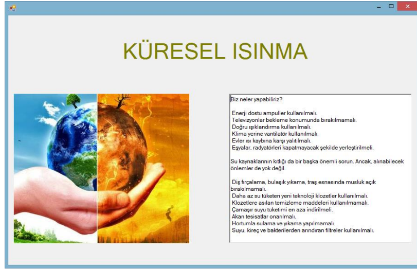
Çizelge 1. Atölye Öğrenme Senaryosu