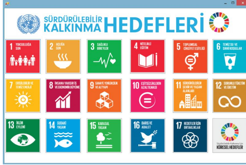
Resim 3. Yazılıma Ait Görsel (Alt Sayfa)